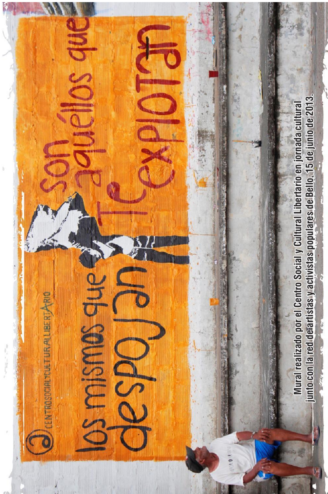
Mural realizado por el Centro Social y Cultural Libertario en jornada cultural junto con la red de artistas y activistas populares de Bello, 15 de junio de 2013.