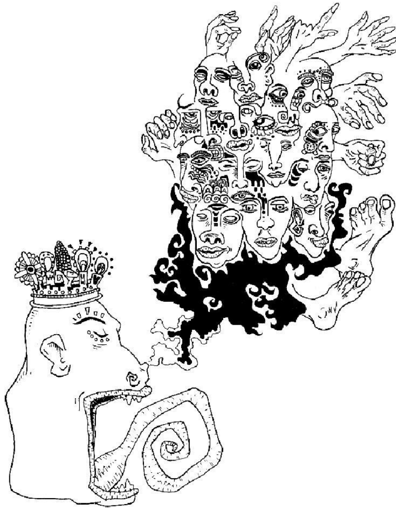
Ilustracion por: Moritz