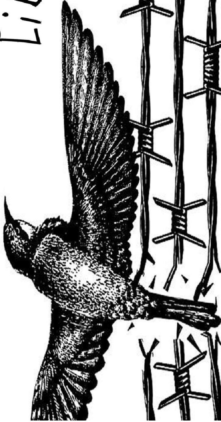
Ilustración por: La Maga, Colombia