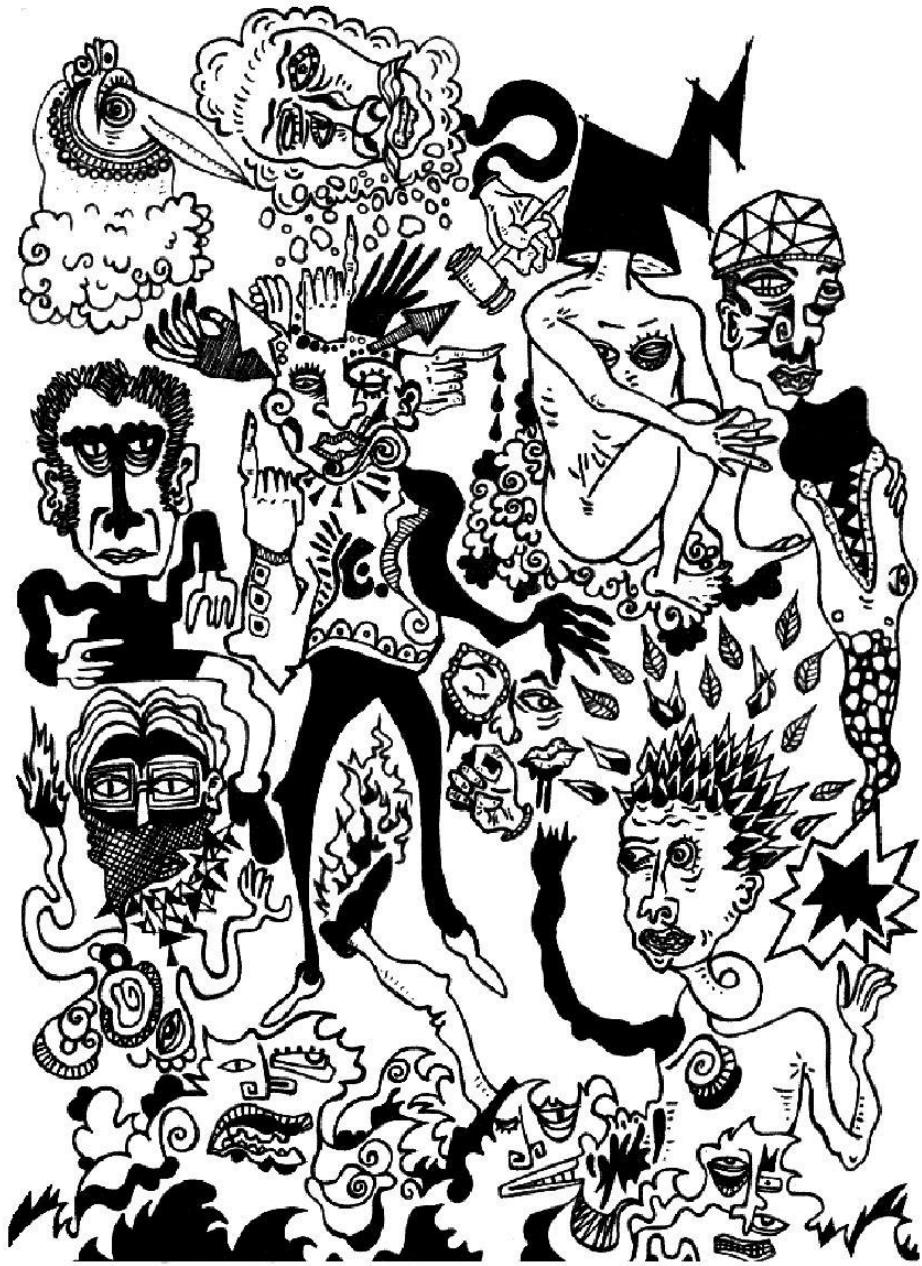
Ilustración por: Moritz