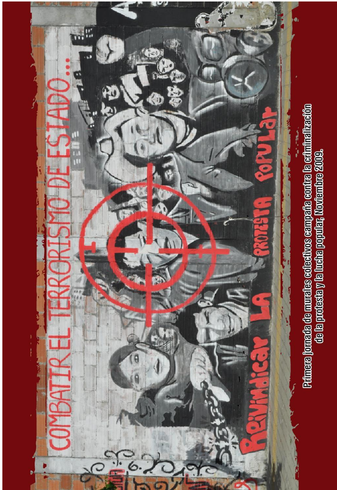
Primera jornada de murales colectivos campaña contra la criminalización de la protesta y la lucha popular, Noviembre 2009.